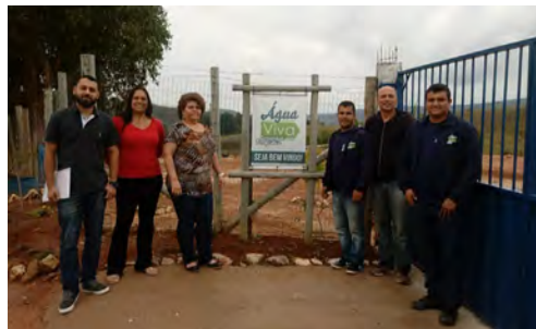
Inspectiebezoek en deel van het team van Aqua Viva

Eind september kregen we een ongepland inspectiebezoek waarbij onze organisatie onder de loep werd genomen. Er werd gekeken of de opgegeven gasten er ook daadwerkelijk waren, daarnaast werden gasten geïnterviewd over hun behandeling. We kregen grootse complimenten die we dankbaar in ontvangst namen!