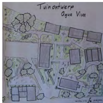
Links onder op het plaatje de plek voor het nieuwe gebouw

We zijn ongelooflijk blij dat we al sponsors hebben gevonden in Nederland die willen helpen deze droom te realiseren. Ook heeft de stichting Aqua Viva het plan voorgelegd aan het Fonds Wilde Ganzen die heeft toegezegd 50% bonus te geven over het in Nederland ingezamelde bedrag. We hopen begin volgend jaar te kunnen beginnen met de bouw en tegelijkertijd ook de sociale woningen op te knappen binnen hetzelfde project. Wat voelen we ons gezegend dat deze lang bestaande wens in vervulling gaat!