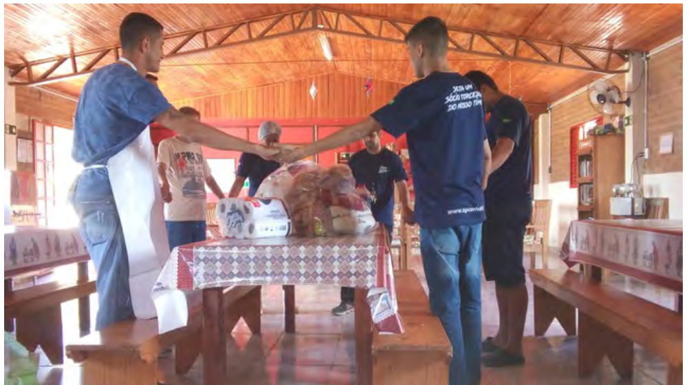
Dankgebed voor de wekelijkse boodschappen

Projectnummers zijn te vinden op de website. Aqua Viva is door A.N.B.I. erkend. Giften zijn aftrekbaar van de belasting.